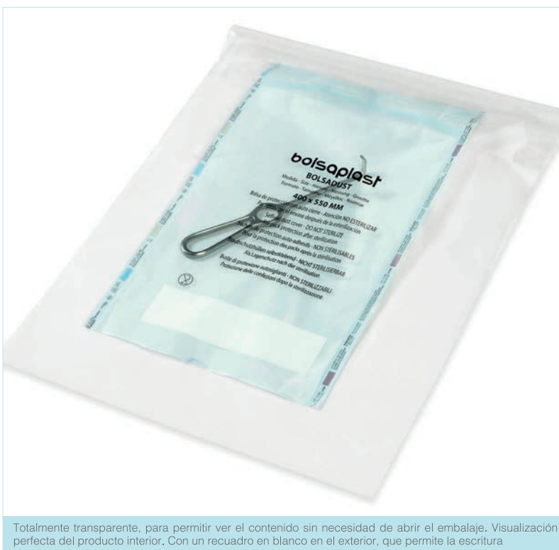
Totalmente transparente, para permitir ver el contenido sin necesidad de abrir el embalaje. Visualización perfecta del producto interior. Con un recuadro en blanco en el exterior, que permite la escritura