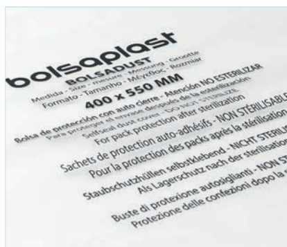
Información de producto y de uso en varios idiomas