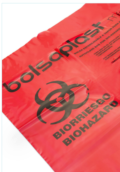
Impresión de logos biorriesgo y de información de uso