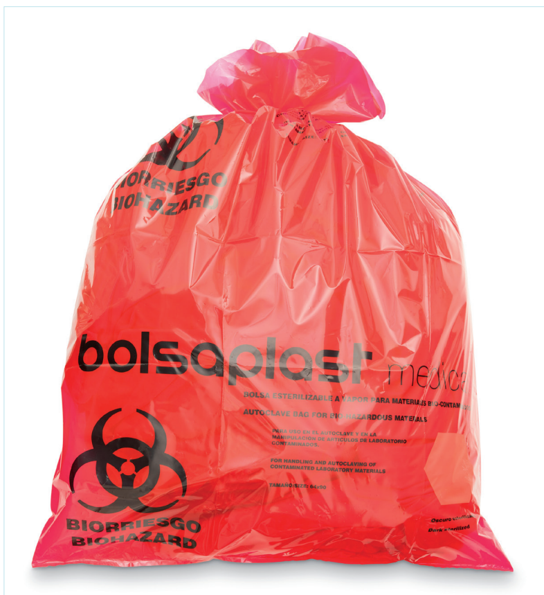
Excelente bolsa de calidad, con fácil visualización de textos y del indicador de VAPOR. En color rojo, para identificación de riesgo